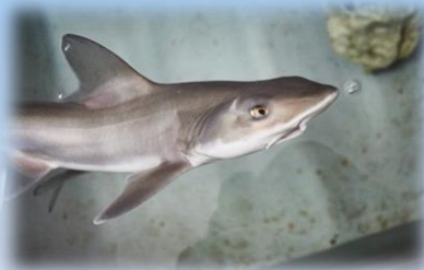
Ispira, squalo nato per partenogenesi