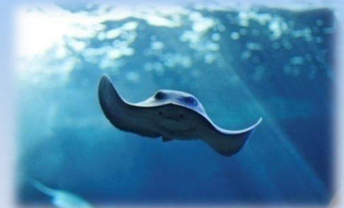
Il Trigone viola nella grande vasca pelagica