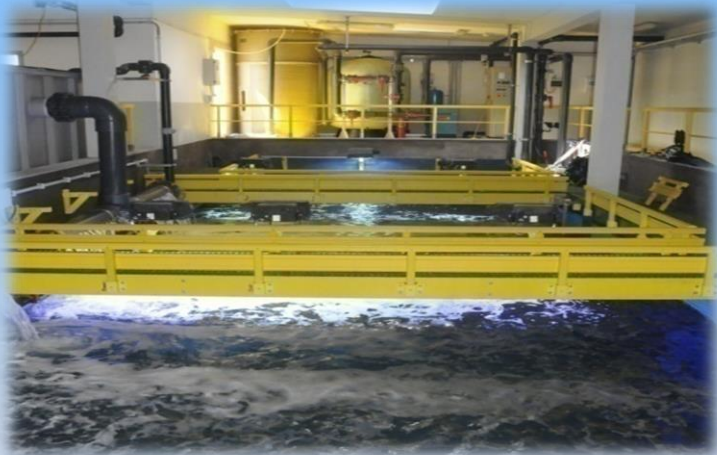
Locali tecnici dell'Acquario di Cala Gonone

Unite la visita tematica al percorso espositivo con la speciale visita ai locali tecnici della struttura... non perdetevi questa esperienza unica!