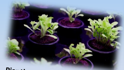
Piantine cresciute in acquaponica

Il percorso, completato da un ampio parco giochi , si conclude con l'emozionante esperienza della vasca tattile , dove potrete interagire con razze, stelle marine, uova di squalo e paguri.