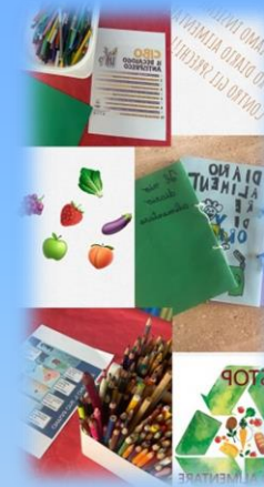
Laboratorio «Il mio diario alimentare contro gli sprechi»

✓ Attività ricreativa nell'area giochi esterna dell'Acquario