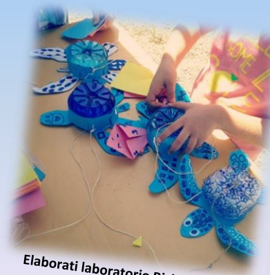
Elaborati laboratorio RiciclAcquario

Il supplemento per la guida lo paghi 1€ in meno!