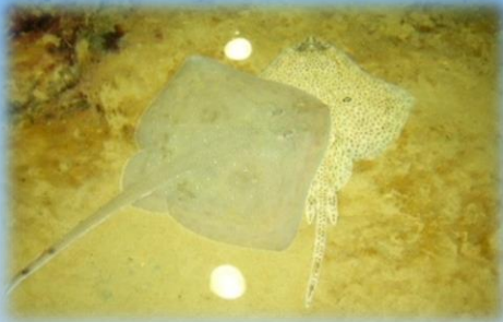
Le razze della vasca tattile

La visita permette di acquisire nozioni generali sulle 300 specie di organismi ospitati nel nostro acquario,