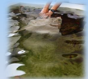
La vasca tattile