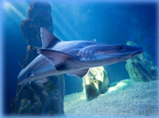
Lo squalo palombo

Conoscere le principali caratteristiche del nostro mare e la vita dei suoi abitanti è il primo passo per poterlo rispettare.