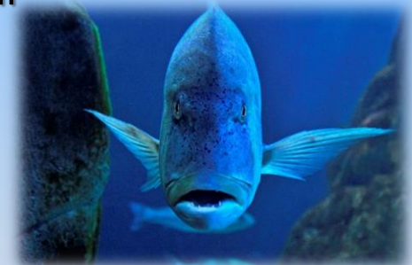
Il dentice, predatore nella grande vasca

sul loro habitat e sulle loro principali abitudini di vita, imparando, insieme ad una guida esperta, a conoscere il mare e a proteggerlo.