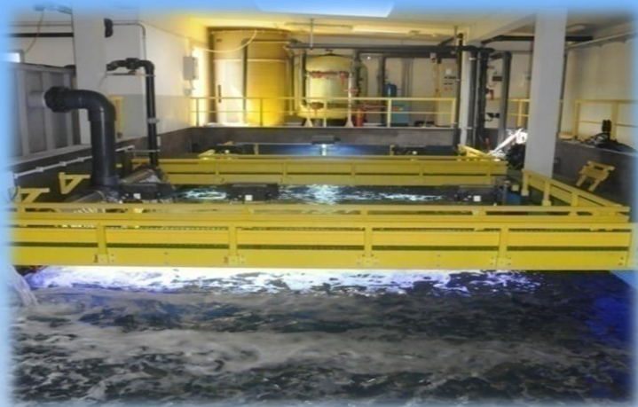
Locali tecnici dell'Acquario di Cala Gonone