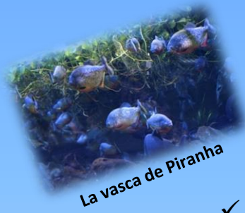
La vasca de Piranha

Una guida esperta li condurrà nel percorso espositivo, illustrando in modo giocoso le meraviglie del mondo sommerso.