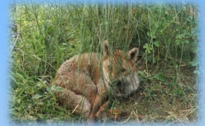
La volpe Rosa Fumetta

Vieni a scoprire come, grazie ad un innovativo impianto di acquaponica , i piccoli pesci Oranda ci aiutano a coltivare gli ortaggi, nel rispetto dell'ambiente, risparmiando il 95% di acqua e il 90% di suolo