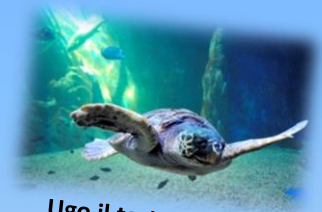
Ugo il tartarugo