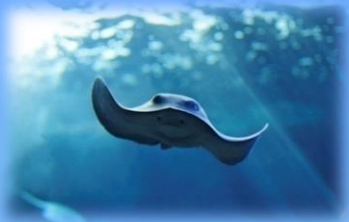
Il Trigone viola nella grande vasca

25 vasche espositive vi aspettano per farvi conoscere le specie tipiche del Mediterraneo : Ugo la tartaruga marina cieca, vittima dell'inquinamento dei nostri mari, la volpe Rosa Fumetta salvata da un incendio boschivo ad Oristano nel maggio 2017, Freezer , la tartaruga alligatore dalla storia difficile, Clotilde , la murena gigante che si nasconde nella sua tana e molti altri amici, come i pesci Piranha e i coloratissimi pesci tropicali .